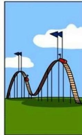
ЗА ЧТО ЗАПЛАТИЛ КЛИЕНТ