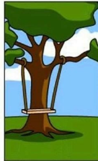
КАК МЕНЕДЖЕР ПРОЕКТА ЭТО ПОНЯЛ