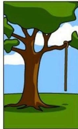
ИНСТРУКЦИЯ ПО УСТАНОВКЕ