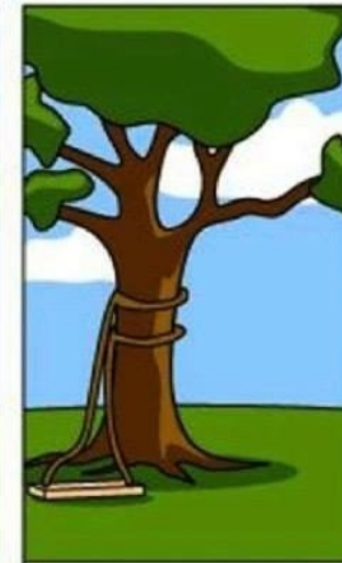
КАК ПРОГРАММИСТ ЭТО НАПИСАЛ