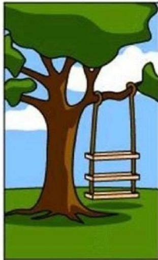
КАК ЗАКАЗЧИК ОБЪЯСНИЛ, ЧТО ЕМУ НУЖНО