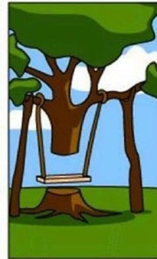
КАК ЭТО СПРОЕКТИРОВАЛИ