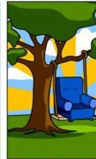
КАК ОТДЕЛ ПРОДАЖ ЭТО ПРЕЗЕНТОВАЛ