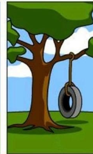
ЧТО ЗАКАЗЧИК ДЕЙСТВИТЕЛЬНО ХОТЕЛ